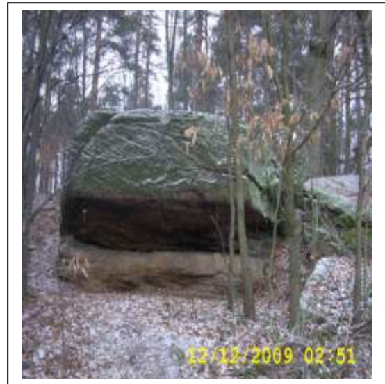
Rezerwat Przyrody „Piekielko Szkuckie”

Położony jest na skraju lasu. Jak czytamy na tablicy informacyjnej, objęte są w nim ochroną "naturalne formy skałkowe ze zlepieńców dolnojurajskich". Powstały około 175-200 mln lat temu ze żwirów osadzających się na dnie morza, które było wówczas na tym terenie. Musiały wywierać duże wrażenie na okolicznych mieszkańcach, którzy ich powstanie przypisali niezemskim mocom i nazwali Piekielkiem. Dopatrzeć się w nich bowiem można niezwykłych kształtów. Jedne wyglądają jak grzyby skalne, przypominają nakładające się na siebie warstwy lawy. Od południowej strony skałki mają pionowe ściany. W jednym miejscu tworzą skalną bramę, niektóre jak mur wyrastają z ziemi. W części skał znajdują się szczeliny. Rosną też na nich i wokół drzewa. W części wschodniej i środkowej rezerwatu, zajmującego dwa i pół hektara, spotkać można pomnikowe sosny i dęby, liczące sobie ponad 150 lat. Od północnej strony widoczne są liczne zagłębienia pozostałe prawdopodobnie po wydobywaniu kamienia.