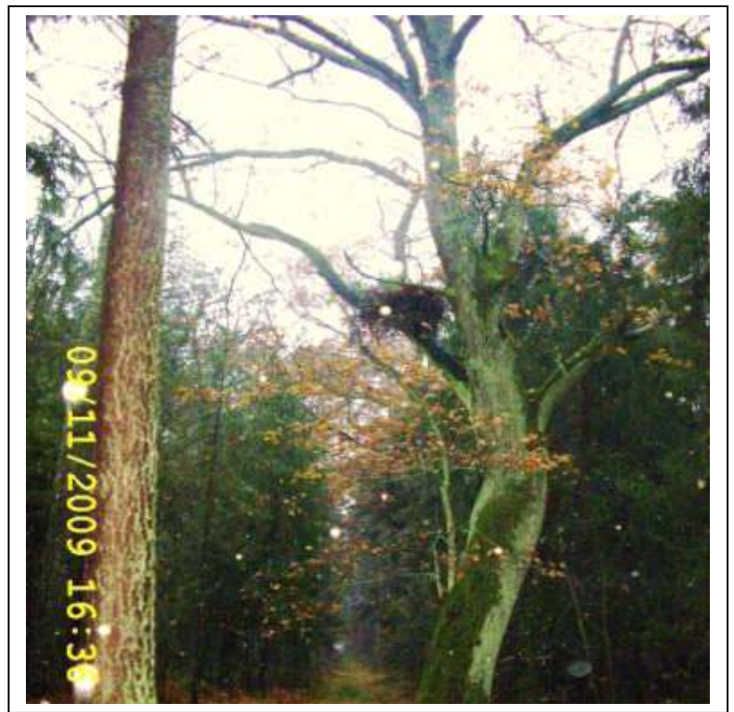
Gniazdo czarnego bociana

Pozostali reprezentanci fauny naszego terenu to: