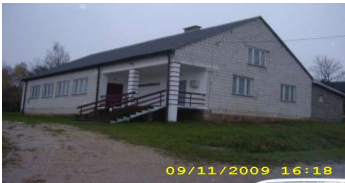
Dom Ludowy w Szkucinie

W Szkucinie znajduje się Wiejski Dom Ludowy, Rezerwat Przyrody „Piekiełko Szkuckie”, Pomnik Przyrody „Żwirowisko”, Pomnik Powstańców Styczniowych oraz kilka kapliczek. Urząd Gminy, przedszkole, poczta, bank, Gminny Ośrodek Pomocy Społecznej, Publiczny Zakład Opieki Zdrowotnej znajdują się w oddalonej o 9 km Rudzie Malenieckiej, natomiast Szkoła Podstawowa oraz Kościół znajdują się w miejscowości Lipa – 2 km od Szkucina.