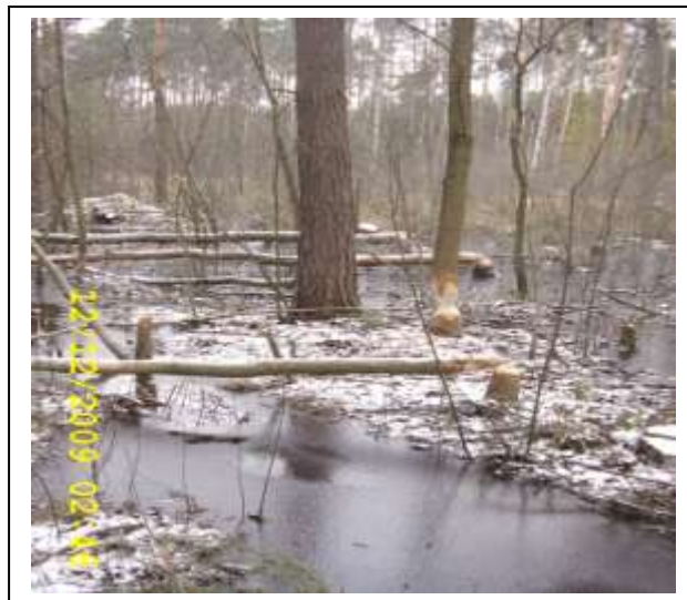
ślady działania bobrów

Równie bogata jest flora w lasach, stawach i na podmokłych łąkach, gdzie można spotkać: