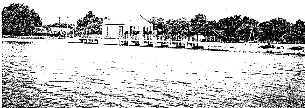
Widok ogólny MEW I