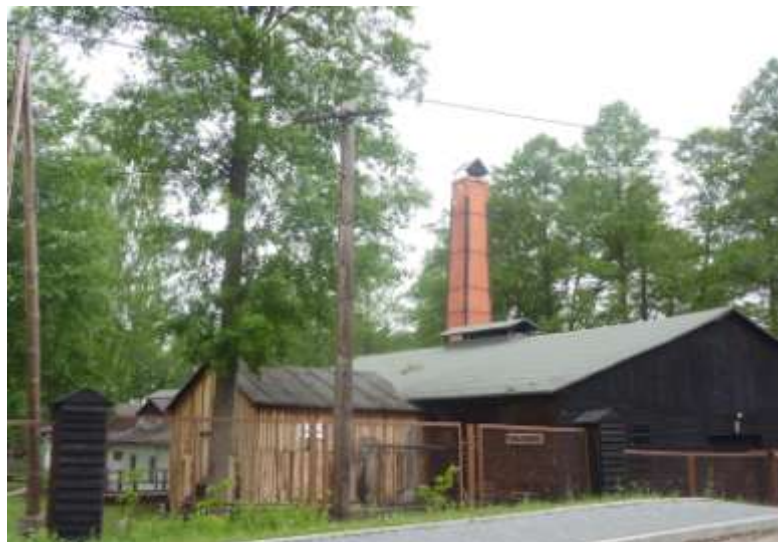
Zdjęcie nr 19. Zabytkowy Zespół Walcowni i Gwoździarni w Maleńcu

Jest to wieś położona przy starej szosie Łódź-Kielce nad rzeką Czarną Konecką, która była kiedyś źródłem energii dla wybudowanych dawniej nad jej brzegami zakładów przemysłowych. W Maleńcu znajduje się Muzeum Techniki stanowiące zespół walcowni i gwoździarni, na miejscu kuźni z XVI-XVIII wieku. W skład zespołu wchodzi: szpadlarnia, walcownia, klatka koła wodnego, magazyn i układ wodny. Jest to unikalny obiekt w skali światowej, który zachował się bez prób unowocześniania od 1874 roku.