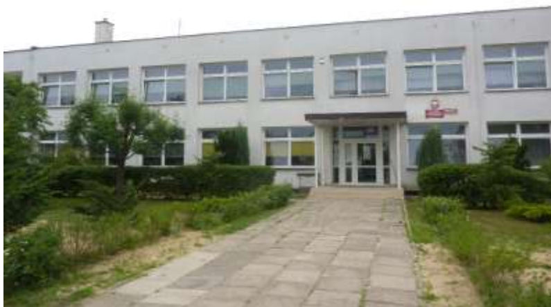
Zdjęcie nr 35: Publiczna Szkoła Podstawowa w Rudzie Malenieckiej – fot. Pro-Inspiracja.pl