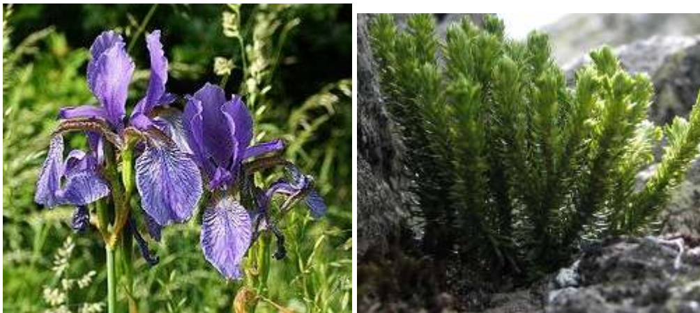
Zdjęcie nr 11: Kosaciec syberyjski i widłak wroniec – roślinność występująca na terenie Gminy Ruda Maleniecka.

Świat roślinny reprezentowany jest tutaj przez takie rzadkie gatunki jak między innymi: wawrzynek wilczełyko, widłak wroniec czy kosaciec syberyjski. Na stawach i podmokłych łąkach można także spotkać: przebiśniegi, bluszcz pospolity, konwalie, rzeżuchę, fiołek błotny, rosiczki, storczyk plamisty, jaskier wielki. Z innych przedstawicieli flory można spotkać: modrzewie, storczyk plamisty, pokrzyk wilcza jagoda, zawilec gajowy, przylaszczka, kopytnik, bluszcz leśny, widłak, borówka brusznica, konwalia majowa, kokoryczka wielokwiatowa, podbiał, jodła pospolita.