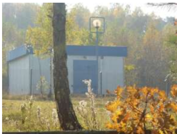
Zdjęcie nr 24: Nieczynne ujęcie wody w Szukucinie, własność Urzędu Gminy.