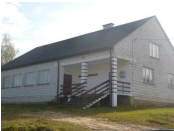
Zdjęcie nr 23: Szukucin – Dom Ludowy.

Warto zobaczyć także odsłonięcie geologiczne w centrum wsi, na wzgórzu za sklepem. Powstało w miejscu wyrobiska żwiru, nazwane jest Gajem. Znajdujące się tam zlepierce skalne są znacznie słabiej „zlepione” niż te w Piekielku. Żwir łatwo „odkleja się” i obsuwa, woda rzeźbi w nich szczeliny i rowy. Na szczycie tego żwirowego wzgórza znajduje się drewniany krzyż, oraz pomnik ku pamięci Papieża Jana Pawła II.