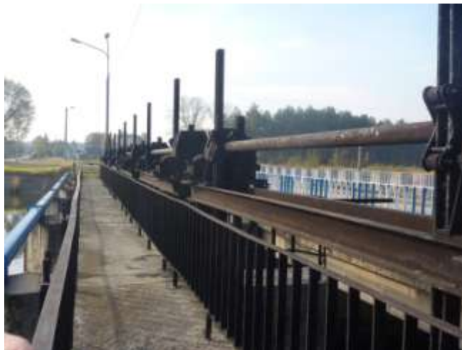
Na zdjęciu nr 13: Urządzenia melioracyjne w Cieklińsku – własność Gminy Ruda Maleniecka.

W okolicach Cieklińska występują torfy związane z torfowiskami dolinnymi powstałymi w Dolinie Czarnej Koneckiej i jej dopływów. Są to torfiska niskie, złożone z torfów trzcinowych i drzewnych. Torfy pochodzą z czwartorzędu i nie są eksploatowane.