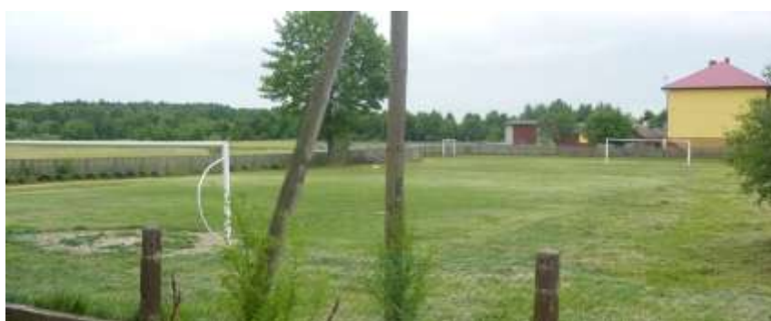
Zdjęcie nr 43: Boisko szkolne w Lipie

Na terenie gminy znajduje się wiele miejsc nadających się na rekreację i wypoczynek np. terenu wokół remiz strażackich czy świetlic, a także wiejskie boiska sportowe - po odpowiednim ich zagospodarowaniu i zapewnieniu bezpieczeństwa mogą stać się miejscem wypoczynku nie tylko mieszkańców, ale również turystów odwiedzających Gminę. Samorząd stara się pozyskiwać środki finansowe na remont i modernizację boisk składając wnioski i uzyskując dotacje np. z Lokalnej Grupy Działania czy też z Lokalnej Grupy Rybackiej.