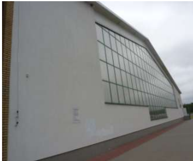
Zdjęcie nr 41: Hala sportowa przy Publicznym Gimnazjum w Rudzie Malenieckiej

W Rudzie Malenieckiej przy gimnazjum znajduje się hala sportowa z której mogą korzystać dzieci i młodzież. Do dyspozycji są również boiska przy szkołach np. Ruda Maleniecka, Lipa oraz w miejscowościach, które dysponują wolnym placem na tego typu miejsce aktywności i rekreacji np. Kołoniec.