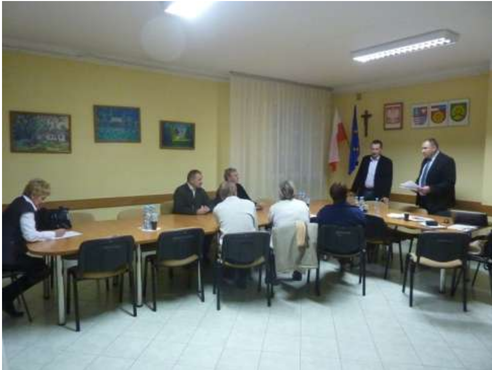
Zdjęcie nr: 5: Spotkanie dot. rozwoju sołectw w miejscowości Ruda Maleniecka 22.11.2011 r.