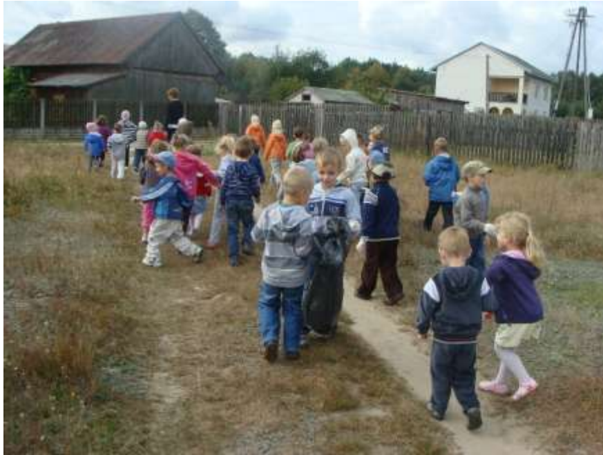
Zdjęcie nr 40: Sprzątanie świata