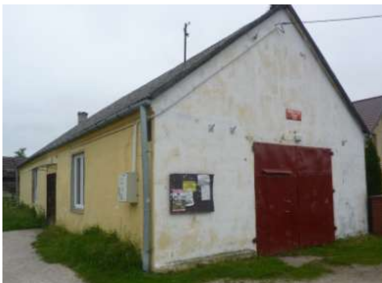
Zdjęcie nr 33: Remiza OSP w Dębnie.

OSP posiada lekki samochód Ford Transit, pompę pływakową. Podczas spotkania ze Stowarzyszeniami członkowie OSP wskazywali na braki w postaci pomp szlamowych, pływających.