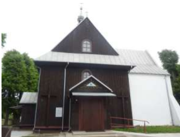
Zdjęcie nr 16: Drewniany kościół w Lipie

Kościół parafialny św. Wawrzyńca w Lipie usytuowany jest w centralnej części wsi. Pierwszy kościół modrzewiowy wybudowano już w roku 1129. Około roku 1636 dziedzic Bartłomiej Ruszeński i pleban Wawrzyniec Tadajewski dobudowali do drewnianego Kościoła murowaną kaplicę Matki Boskiej Różańcowej. Ksiądz Wiśniewski