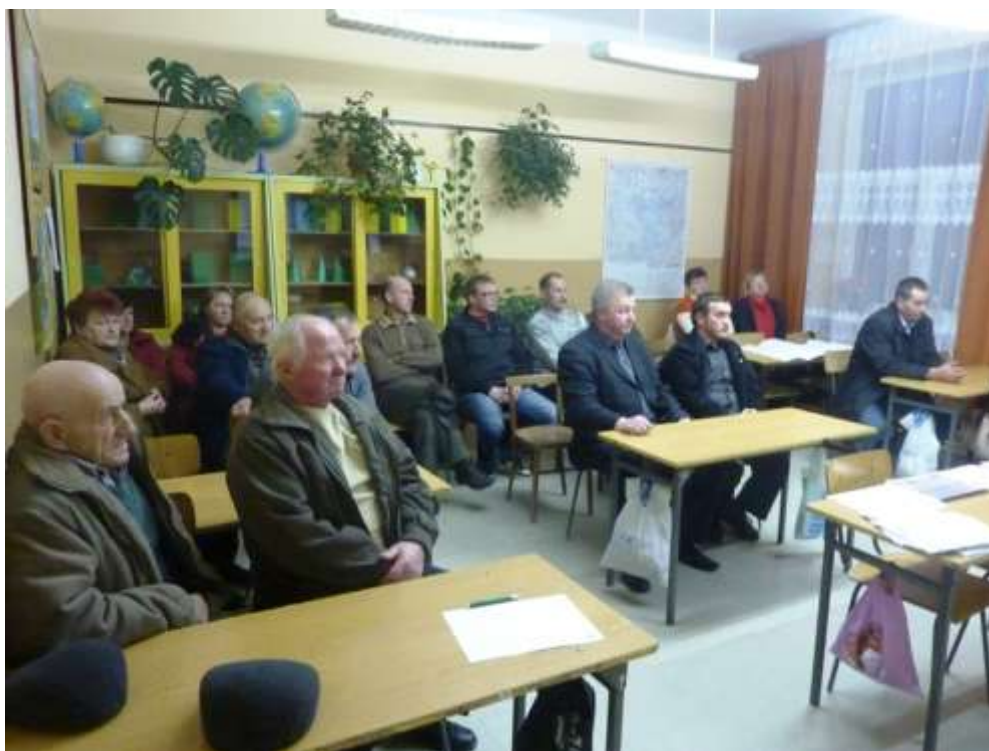
Zdjęcie nr 4: Spotkanie w sprawie Strategii w miejscowości Lipa 21.11.2011r.