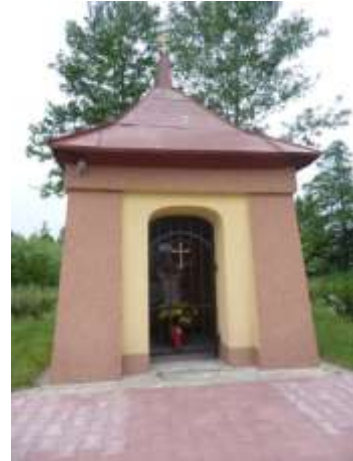
Zdjęcie nr 20: Odnowiona w 2010r. kapliczka św. Jana zlokalizowana w miejscowości Młotkowice. Fot. Pro-Inspiracja.pl

Zdjęcie nr 21: Dom Ludowy w Młotkowicach wyremontowany z Programu Rozwoju Obszarów Wiejskich – działanie „Odnowa i rozwój wsi”. Fot. Pro-Inspiracja.pl