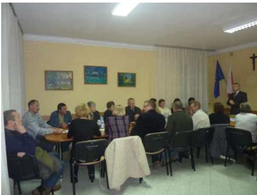
Zdjęcie nr 2: Spotkanie strategiczne z sołtysami i radnymi w sprawie Strategii w dniu 09.11.2011r.