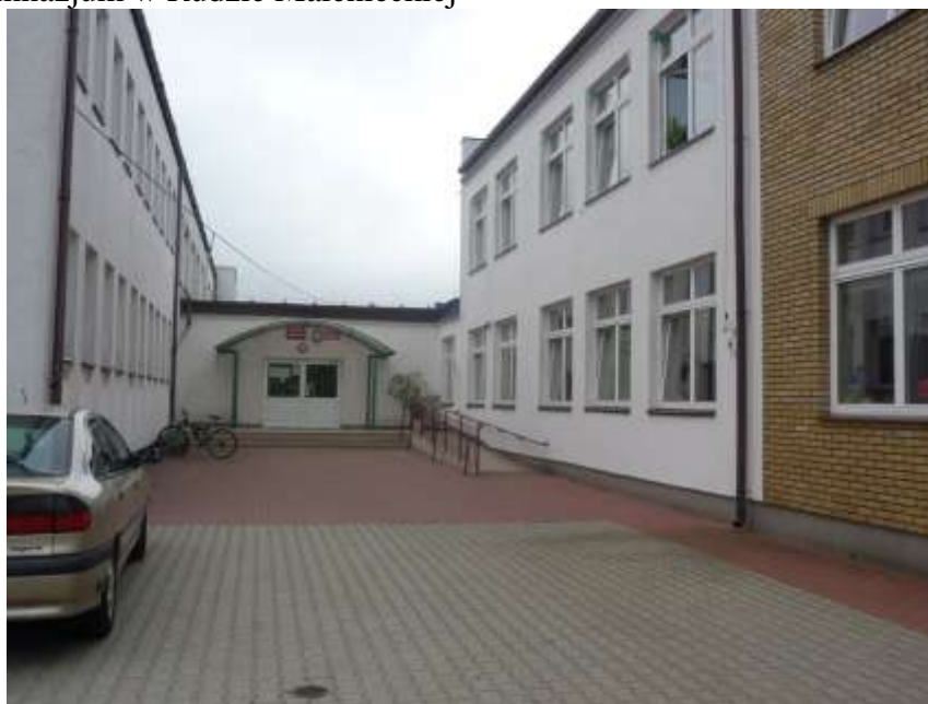
Zdjęcie nr 34: Publiczne Gimnazjum w Rudzie Malenieckiej

Gimnazjum w Rudzie Malenieckiej działa od 1 września 1999r. Szkoła pracuje w bardzo dobrych warunkach. W budynku znajduje się 8 sal lekcyjnych. W roku szkolnym 2009/2010 w sześciu oddziałach uczyło się 100 uczniów z terenu całej Gminy.