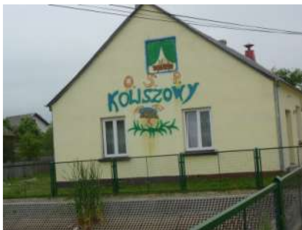
Zdjęcie nr 29: Remiza OSP Koliszowy.