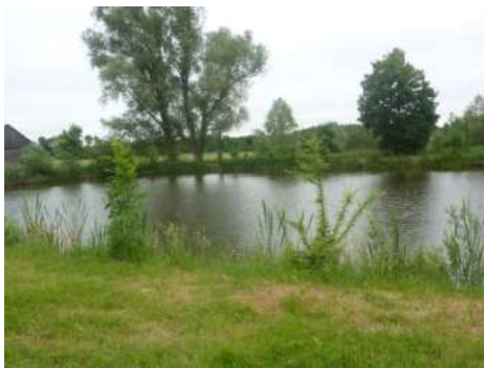
Zdjęcie nr 8. Staw w miejscowości Dęba Kolonia

Przez obszar gminy przepływa rzeka Czarna Konecka (klasa czystości II) – prawy odpływ Pilicy, wokół której powstało wiele zbiorników wodnych, głównie stawów, w których prowadzona jest hodowla ryb. Obszar gminy cechuje się dużą gęstością sieci rzecznej w postaci licznych cieków wodnych.