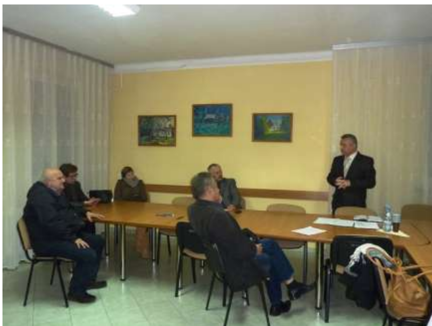
Zdjęcie nr 1: Spotkanie strategiczne z przedsiębiorcami - 07.11.2011r.