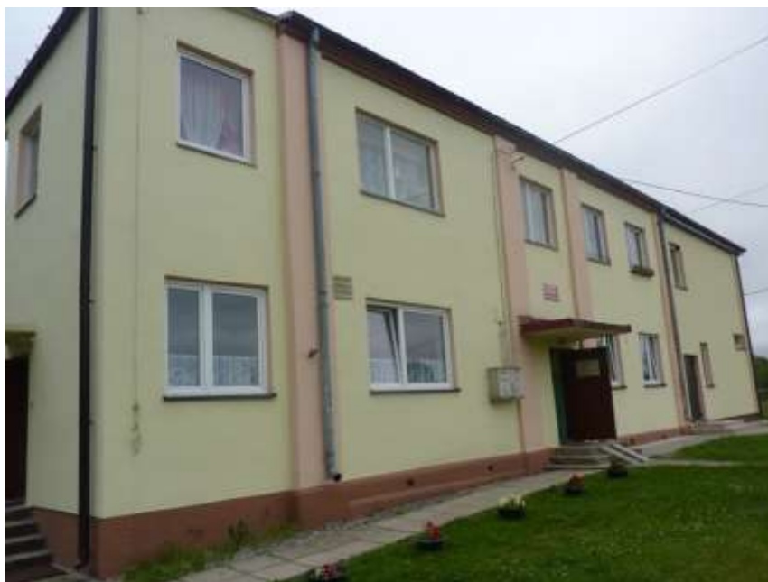
Zdjęcie nr 38: Publiczne Przedszkole w Rudzie Malenieckiej

Przedszkole w Rudzie Malenieckiej mieści się w budynku z lat 80-tych XX-wieku. W styczniu 2011 roku dzięki projektowi „Świat Malucha” współfinansowanego przez Unię Europejską w ramach Europejskiego Funduszu Społecznego utworzono dodatkowy oddział przedszkolny. Liczba dzieci wzrosła z 24 do 48. W budynku miesi się również oddział „0”, do którego uczęszcza 12 sześciolatków. Placówka posiada trzy sale do prowadzenia zajęć. Budynek wyposażony jest w szatnię, łazienki oraz kuchnię. Dzieci mogą korzystać z placu zabaw umiejscowionego tuż obok budynku przedszkola oraz ogólnodostępnego placu oddanego do użytku w 2011r. sfinansowanego z tzw. małej odnowy wsi – konkursu Urzędu Marszałkowskiego Województwa Świętokrzyskiego.