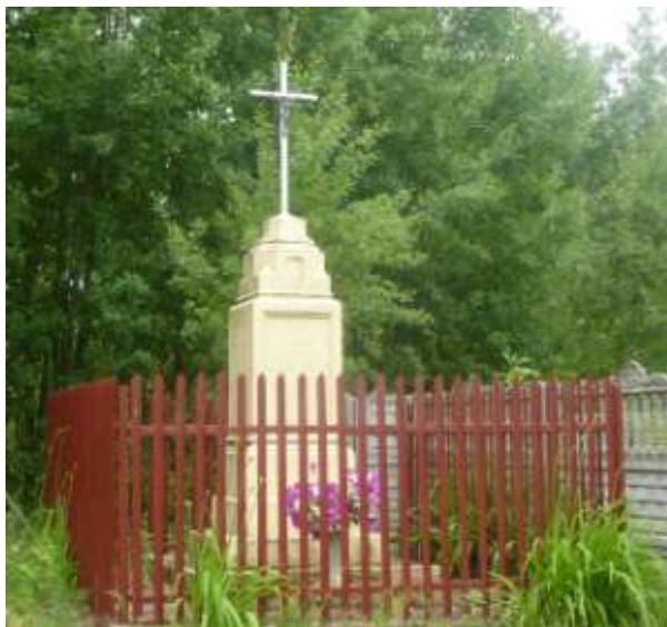
Zdjęcie nr 25: Krzyże przydrożne na terenie Gminy Ruda Maleniecka.

Na terenie Gminy Ruda Maleniecka znajduje się wiele krzyży i kapliczek przydrożnych. Stanowią one bezcenne bogactwo krajobrazu. Niektóre z nich stoją na uboczu, zapomniane przez ludzi, inne toną w kwiatach i są miejscem spotkań okolicznych mieszkańców. Stawiano je z różnych powodów i w różnych czasach. Żaden z nich nie powstał przypadkowo, każdy do czegoś nawołuje, przypomina o jakimś zdarzeniu.