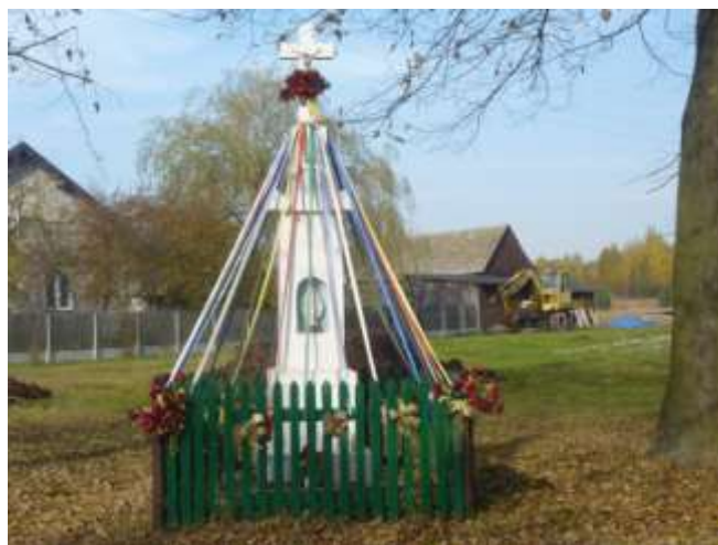
Zdjęcie nr 15: Kapliczka zlokalizowana w miejscowości Hucisko.