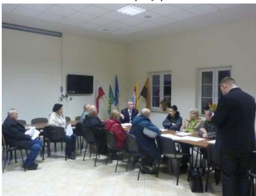
Zdjęcie nr 7: Spotkanie w sprawie Strategii w miejscowości Maleniec w dniu 23.11.2011r.

Na zadawane pytanie podczas zebrań z mieszkańcami z czym kojarzy się Gmina Ruda Maleniecka w ich opinii – padały odpowiedzi: