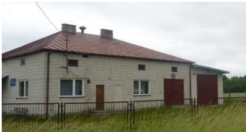
Zdjęcie nr 31: Remiza OSP w Wyszynie Falkowskiej.

Jednostka licząca 26 osób została założona w 1953r. i stanowi ona punkt alarmowania. Prezesem OSP jest Adam Tasak. W ostatnim czasie w budynku remizy OSP przeprowadzono prace remontowe przy garażu i adaptację małego garażu na pomieszczenie socjalne. Jednostka posiada samochód bojowy, helmy strażackie – 6 szt.