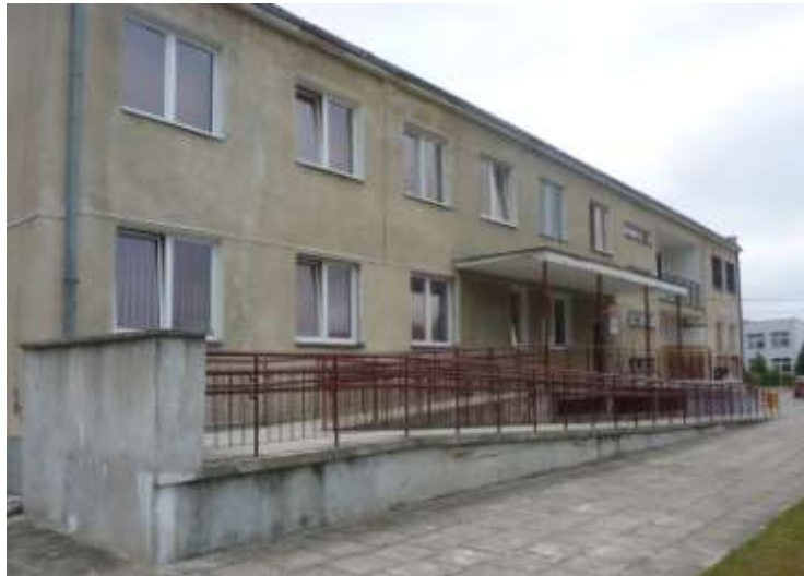
Zdjęcie nr 26: Publiczny Zakład Opieki Zdrowotnej w Rudzie Malenieckiej

Na terenie Gminy funkcjonuje jeden Publiczny Zakład Opieki Zdrowotnej w Rudzie Malenieckiej.