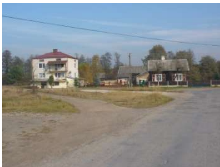
Zdjęcie nr 12: Skwer w miejscowości Cieklińsko, własność Gminy Ruda Maleniecka. W niewielkiej odległości od skweru jest budowany dom ludowy.

W miejscowości Cieklińsko obok skweru budowany jest obecnie Wiejski Dom Ludowy – zlokalizowany na działce nr 807/7 o powierzchni użytkowej 155m 2 . Sołectwo to jest położone wśród pięknych, atrakcyjnych turystycznie rozlewisk rzeki Czarnej Koneckiej. Korzystnymi elementami dla rozwoju szeroko rozumianej turystyki są zasoby leśne oraz czyste ekologicznie wody.