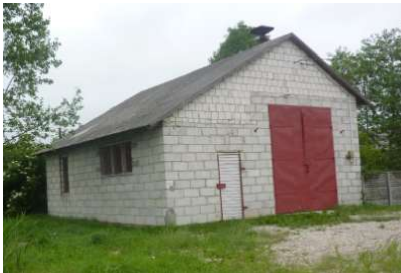
Zdjęcie nr 32: Remiza OSP w Młotkowicach.

OSP Młotkowice posiada samochód lekki Volkswagen T4, pompy pływakowe oraz elementy umundurowania: ubrania lekkie, hełmy, buty.