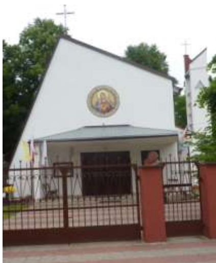
Zdjęcie nr 18: Kaplica w miejscowości Machory

Machory są wsią położoną nad Czarną posiadającą bogate tradycje przemysłowe. Jej nazwa należy do rodowych, które pierwotnie oznaczały członków jednego rodu. W 1510r. wymieniona jest kuźnia wodna, w drugiej połowie XVIII wieku wielki piec, w XIX wieku kopalnia rudy żelaza. Wielki piec czynny był do 1880r. Obecnie można zobaczyć