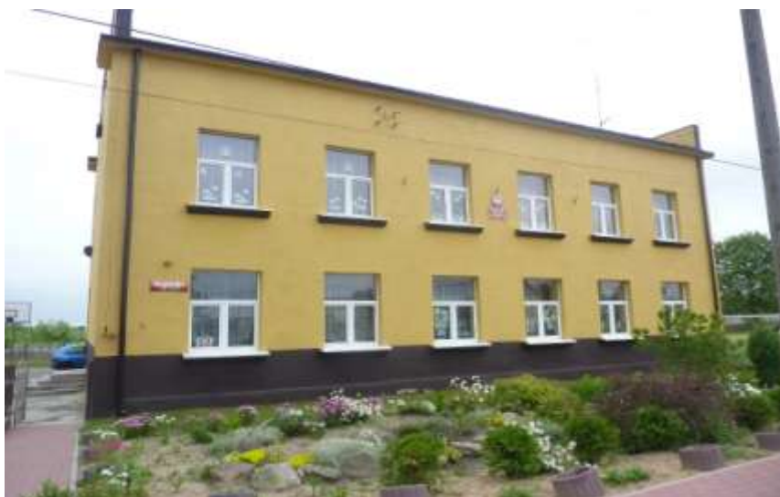
Zdjęcie nr 37: Publiczna Szkoła Podstawowa w Rudzie Malenieckiej – Szkoła Filialna w Lipie – fot. Pro-Inspiracja.pl

W roku szkolnym 2011/2012 do placówek oświatowych na terenie Gminy uczęszcza 342 uczniów, w tym 68 dzieci to wychowankowie przedszkola i oddziałów zerowych. W oddziałach szkół podstawowych uczy się 178 dzieci natomiast w gimnazjum 96 uczniów.