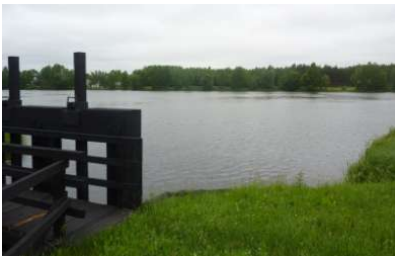
Zdjęcie nr 9: Staw z zaporą w miejscowości Maleniec

Na terenie Gminy zlokalizowanych jest szereg stawów rybnych. Aktualnie kilka gospodarstw prowadzi hodowlę ryb w stawach o łącznej powierzchni 315 ha. Gospodarstwa rybackie oprócz karpia wprowadziły do hodowli takie gatunki jak: szczupak, sandacz, sum, jaź, lin, karaś.