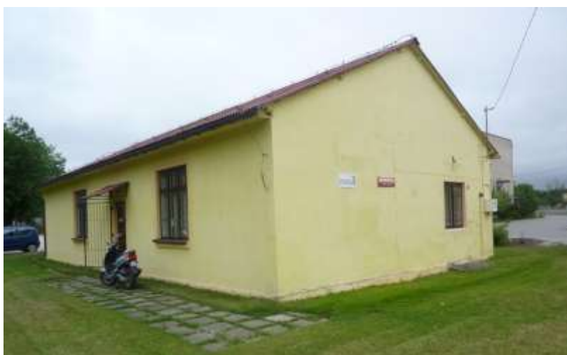
Zdjęcie nr 44: Gminna Biblioteka Publiczna w Rudzie Malenieckiej

Księgozbiór w miarę możliwości jest uzupełniany o nowe pozycje - w 2010r. zakupiono 533 książki. Czytelnicy Biblioteki mają również możliwość skorzystania z Internetu.