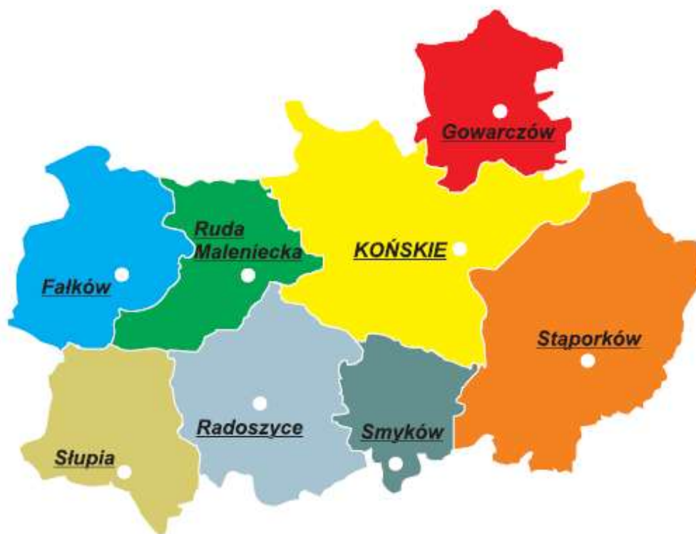
Mapa nr 1 - Gmina Ruda Maleniecka na tle Powiatu Koneckiego.

Gmina Ruda Maleniecka usytuowana jest w północno – zachodniej części województwa świętokrzyskiego. Jej tereny rozciągają się na krańcach najstarszych w Europie Gór Świętokrzyskich. Zgodnie z podziałem fizyczno – geograficznym znajduje się w obrębie makroregionu Wyżyny Kielecko – Sandomierskiej i Wyżyny Przedborskiej. Administracyjnie stanowi jedną z ośmiu gmin powiatu koneckiego zlokalizowaną w jego północno – zachodniej części. Graniczy od północy z gminą Żarnów (powiat opoczyński, województwo łódzkie), od północnego - wschodu z gminą Końskie, od zachodu z gminą Falków, zaś od południa sąsiaduje z gminami: Radoszyce oraz Słupia Konecka. Przez teren gminy przepływa rzeka Czarna Konecka – prawy dopływ Pilicy.