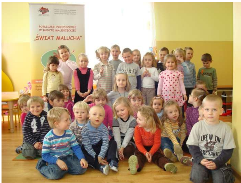
Zdjęcie nr 39: Przedszkolaki 2011/2012

w kuchni przedszkola. 48 dzieci korzysta ze śniadania, obiadu składającego się z dwóch dań i podwieczorku. Natomiast dla 12 przygotowywane są obiady odpłatne. Placówka opiekuje się dziećmi w dni powszednie w godzinach 7:00-16:00.