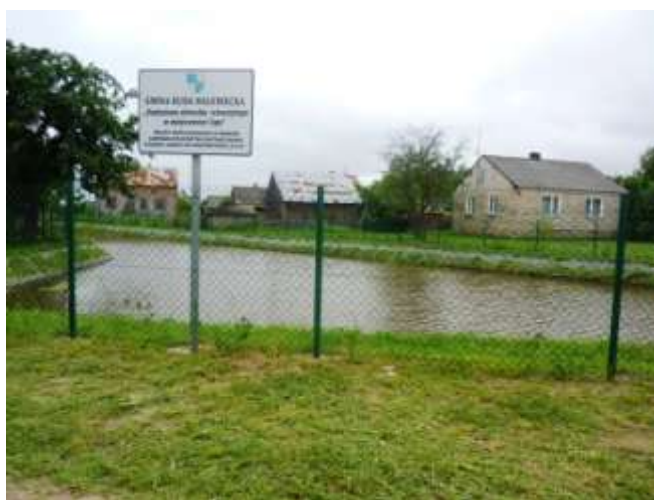
Zdjęcie nr 17: Zbiornik retencyjny w miejscowości Lipa.

Kościół ma konstrukcję zrębową z drewna modrzewiowego, wzmocnianą lisicami. Elewacje pokryte są szalunkami z desek na „styk”, zwieńczone gzymsem pod okapowym. Nad pokrytymi blachą dachami wznosi się smukła wieżyczka sygnaturki z arkadową latarnią, nakryta cebulastym hełmem.