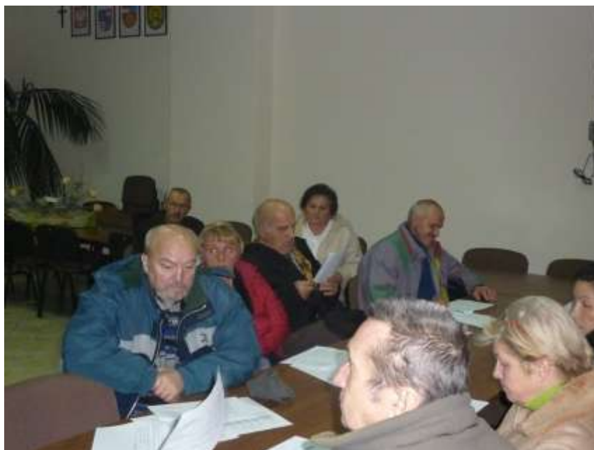
Zdjęcie nr 6: Spotkanie w sprawie Strategii w miejscowości Maleniec w dniu 23.11.2011r.