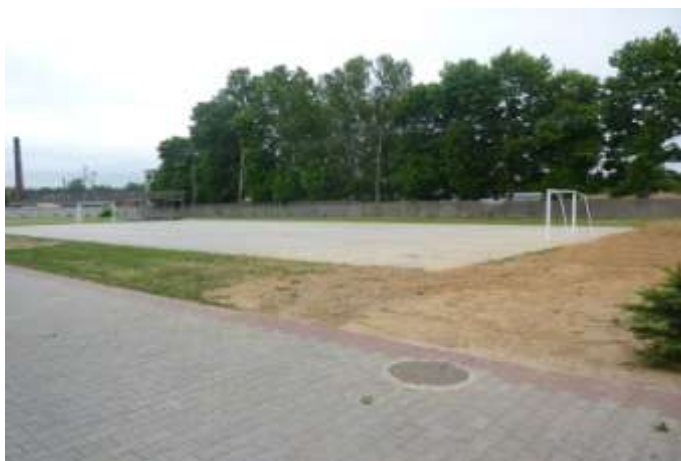
Zdjęcie nr 42: Boisko szkolne w Rudzie Malenieckiej – fot. Pro-Inspiracja.pl