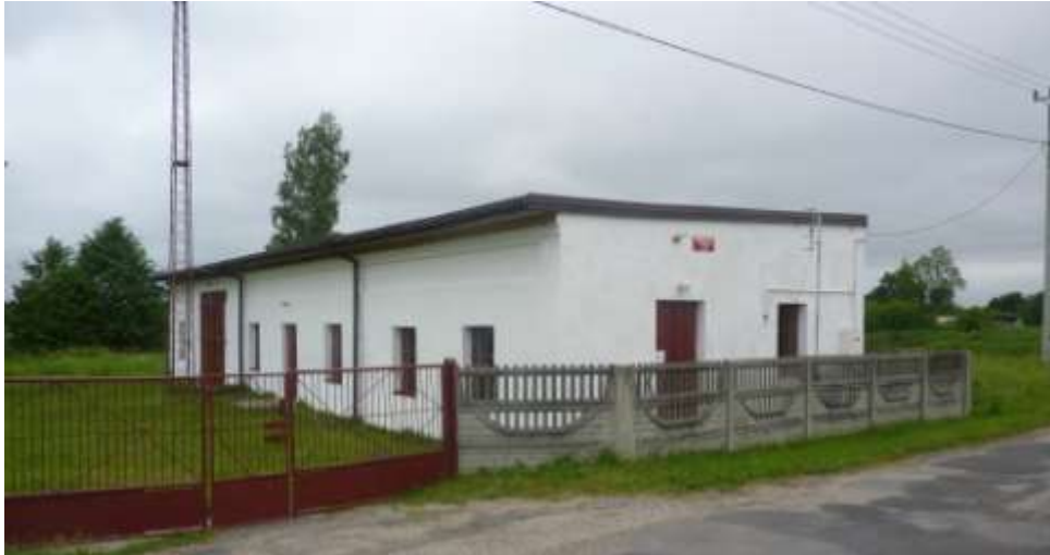
Zdjęcie nr 30: Remiza OSP w Kołońcu.