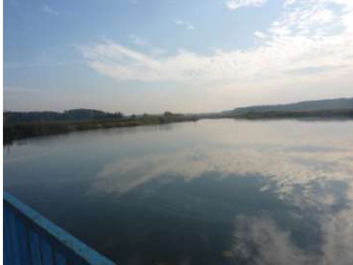
Zdjęcie nr 22: Zbiornik wodny w miejscowości Ruda Maleniecka.

W układzie przestrzennym miejscowości Ruda Maleniecka jest widoczny wpływ uwarunkowań historycznych – dużą rolę w przeszłości odgrywał tzw. „kaszteleński gościniec”, czyli droga z Miedzierzy do Maleńca, którą transportowano surowiec do okolicznych fabryk. Najważniejsze instytucje były umieszczone przy tymże gościńcu: dwór, kaplica, młyn, kantor, karczma, czworaki, tartak, remiza, kuźnie, ochronka, stacja rybacka. Dziś „kaszteleński gościniec” to droga krajowa. Wiele dawnych zabudowań wciąż istnieje, ale powstały także nowe – Szkoła, kościół, budynek Urzędu Gminy i Ośrodka Zdrowie, restauracja, sklepy. W miejscowości nie ma rynku, ani dużego placu pełniącego tego typu funkcje. Ruda Maleniecka dzieli się na przysiółki zwyczajowo zwane: Doświadczalnia, Lipianka, Piaski, Praga, Dwór, Kantor, Chojna, Czapla, Wielki Las.