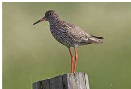
Zdjęcie nr 10: Rycyka oraz krwawo dziób - rzadkie gatunki ptaków występujące na terenie Gminy Ruda Maleniecka

Okoliczne zbiorniki wodne cechuje duża różnorodność form życia. Mają tu swoje siedliska wydry oraz bobry z mozołem budujące żeremia. Środowisko naturalne w Gminie nie ma oznak dużej degradacji o czym świadczy duża liczba ptactwa chronionego: