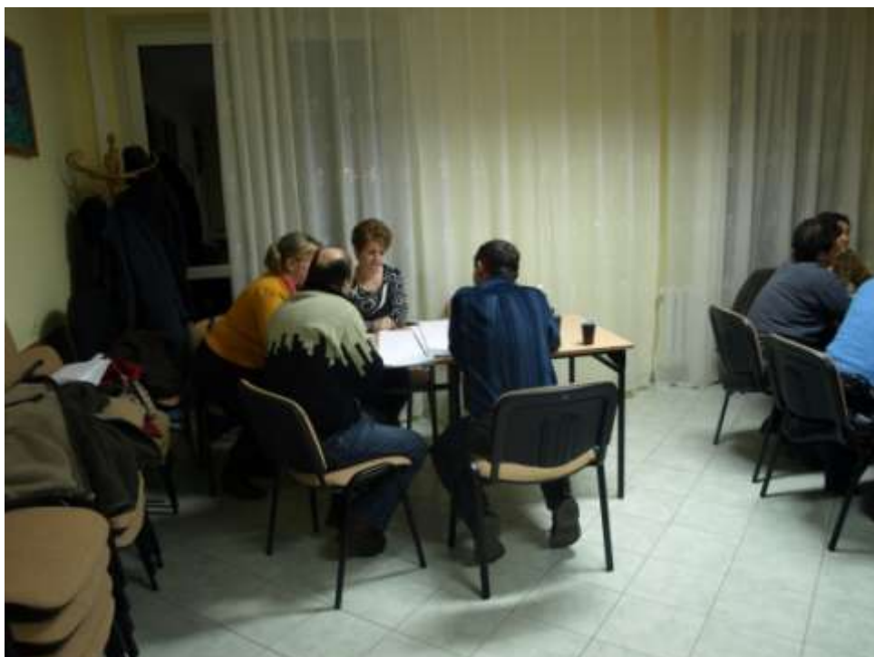
Plan Odnowy Miejscowości Młotkowie wypracowywany był metodami oddolnymi.

Warsztaty w dniu 17 grudnia 2008 roku.