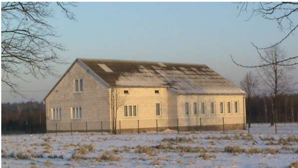
Wiejski Dom Ludowy

W Młotkowicach znajduje się Wiejski Dom Ludowy, strażnica OSP oraz bardzo wiele kapliczek. Aktywnie działa Koło Gospodyń Wiejskich (dalej: KGW) oraz jednostka Ochotniczej Straży Pożarnej (dalej: OSP).