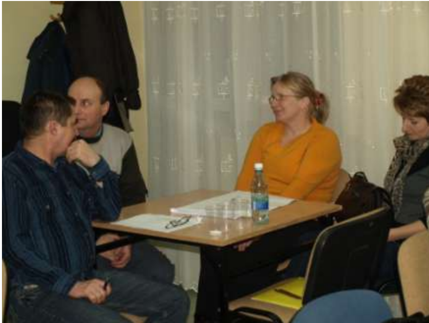
Prace nad opracowaniem Planu Odnowy Miejscowości. 16.12.2008 r.