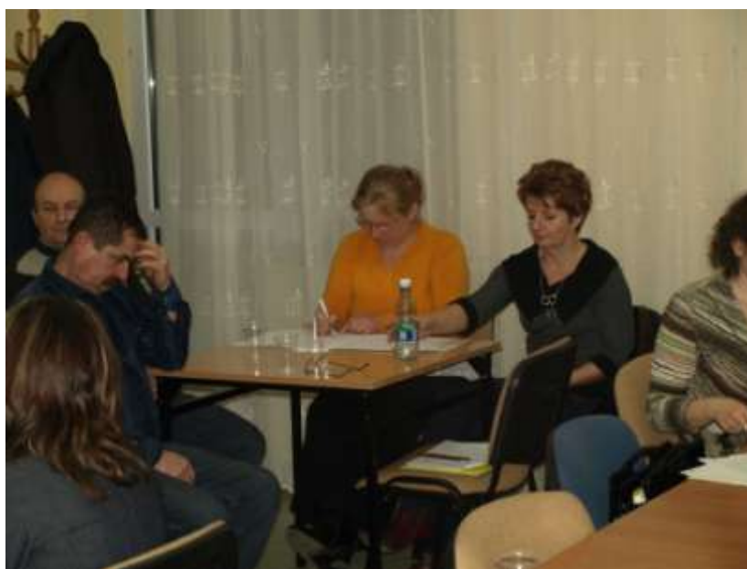
Praca grupy roboczej w dn. 16 grudnia 2008 r.

Plan opracowany został przez Piotra Pałgana