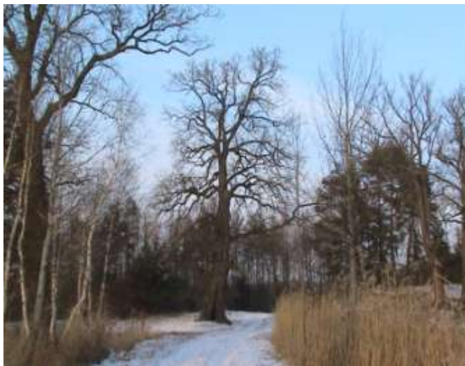
600-letni dąb na Starzyku

Szczycimy się tym, że środowisko, w którym żyjemy nie ma oznak degradacji. Świadczy o tym chociażby duża liczba ptactwa, w tym chronionego: