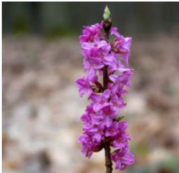
Wawrzynek wilcze łyko

W pobliskich lasach można spotkać rzadkie gatunki roślin: wawrzyńka wilczełyko, widłaka wronca a na sąsiadujących z nimi łąkach kosaćca syberyjskiego.