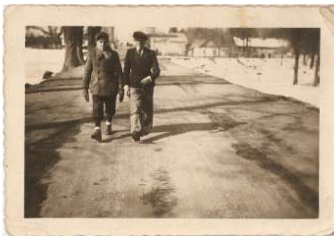
Ruda w latach 1930 - tych. W tle gisernia.