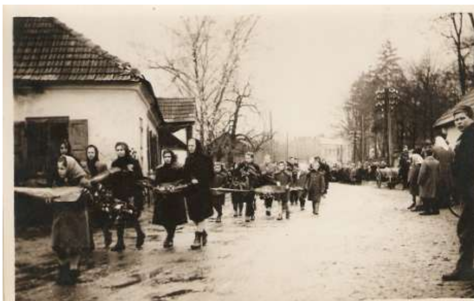
Rok 1945 – pogrzeb strażaków zamordowanych przez hitlerowców w 1943 r.