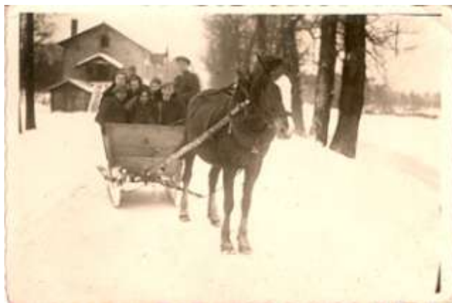
Ruda w latach 1930 - tych. W tle „fabryka”.